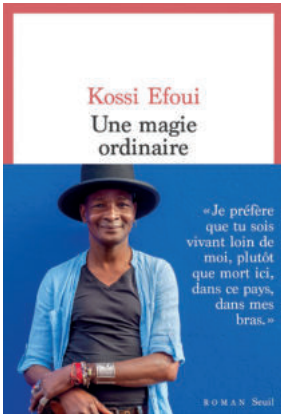
Une magie ordinaire – Kossi EFOUI Seuil, 2023 (Collection Cadre rouge)

Il y a un moment, dans une vie, où l'écrivain abat ses cartes, pris par une sorte d'urgence. Le déclencheur de ce récit bouleversant, c'est un appel téléphonique d'un frère perdu de vue, annonçant que leur mère est au plus mal, à l'hôpital de Lomé. La mère qui lui a dit vingt ans plus tôt : « Va vivre. Va vivre ailleurs et ne reviens plus. » Qui se déplace une bassine sur la hanche, colportant des morceaux de pain, jusqu'au jour où des soldats interceptent son menu commerce, et où il arrive ce qui doit arriver.